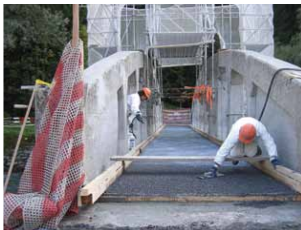
Egy többfunkciós UTSzB réteg beépítése (erősítés, szigetelés, pályalemez burkolat)