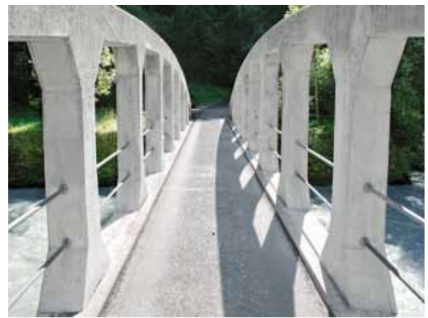
A Dalvazza melletti Landquart híd a javítás előtt és után