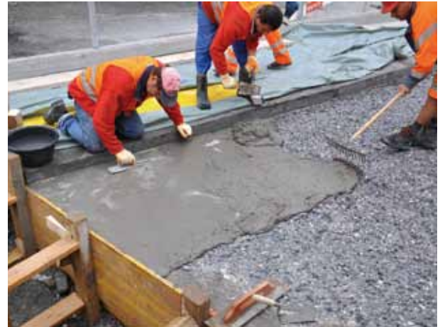
Az UTSzB felületképzése