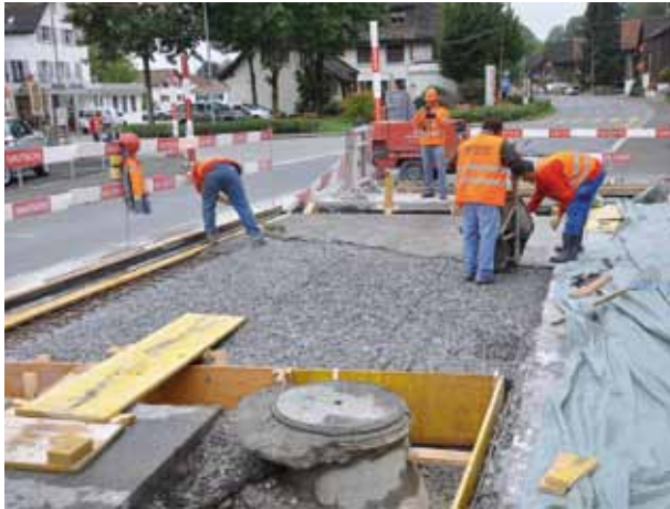
Az UTSzB szigetelőréteg beépítése