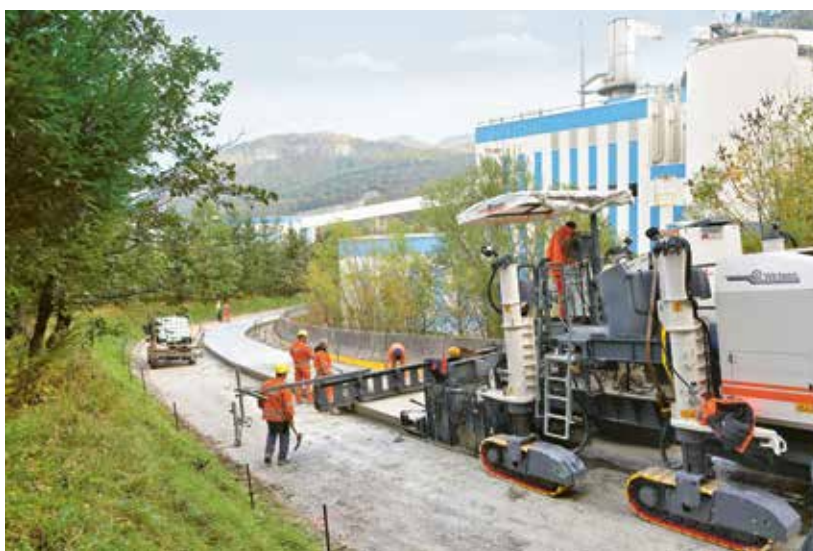
17. ábra: Beépítés meredek terepen