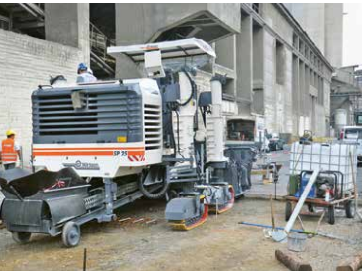
3. ábra: A felpályás közlekedés esete

Már az elején felvetődött a kérdés, hogy nagy terhelés és ugyanakkor kis sebesség esetén valóban kényszerítően szükség van-e a kemény adalékanyagra (német: Hartgestein) (összeálló kőzet, zúzottkőhöz). Kemény adalékanyaghoz a helyi földrajzi adottságok miatt nem olyan egyszerű hozzájutni, mint a homokos kavicsához, illetve az előbbi drágább is. A hosszú élettartam érdekében végül a két sávot különböző kőzetanyagból készítették el (16. ábra). A betonokat a tervezett 30 éves használati élettartam alatt folyamatosan ellenőrzik (monitorozzák), különösen a kopás és a felületi tapadás szempontjából.