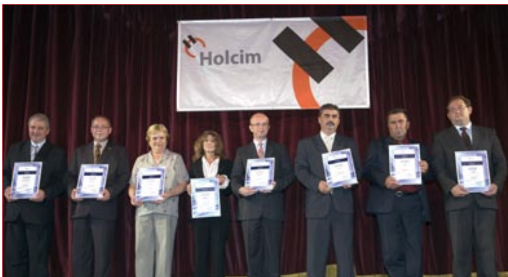
Az idei győztes pályázatok képviselői a díjátadó ünnepségen