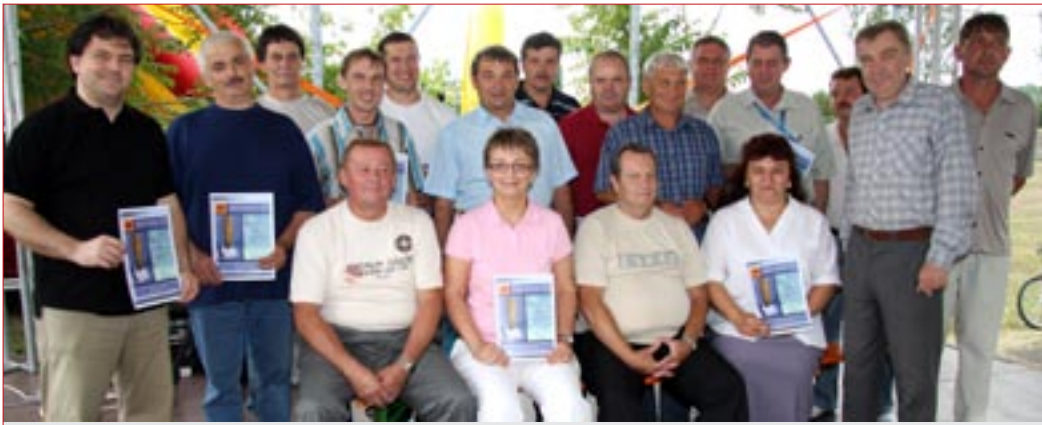
Miskolci törzsgárda tagok

A hagyományok szerint több mint ötven éve minden év júniusának első vasárnapján több százezer építő- és építőanyagipari dolgozó ünnepli meg az Építők Napját.