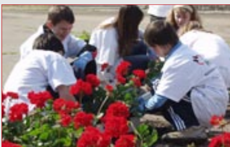
Két városban összesen több mint ezer virágot ültettek el

Májusban két helyszínen, Nyergesújfalun és Hejőcsabán is tartottak Környezetvédelmi napot a Holcim Hungária Zrt. szervezésében. Május 15-én a Szilágyi Dezső Általános Iskola hejőcsabai és görömbölyi tagiskolájának diákjai, majd május 23-án a Nyergesújfaluban és környékén élő iskolások vettek részt a rendezvényen.