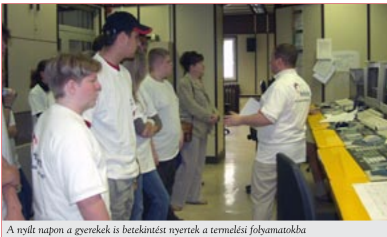
A nyílt napon a gyerekek is betekintést nyertek a termelési folyamatokba

A diákoknak rendezett Környezetvédelmi Nap mellett 2008. május 15-én a Holcim Hungária Zrt. megnyitotta Hejőcsabai Cementgyárának kapuit. Ennek keretében a helyi civilek, önkormányzati képviselők, a környező települések polgármesterei és a sajtó munkatársai bepillantást nyerhettek a cementgyártás folyamatába. A látogatók részletesen megismerkedhettek azokkal a lépésekkel, melyeket a Holcim tesz és tett a