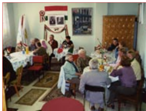
Az avatás után egy kis eszmecsere a klubban