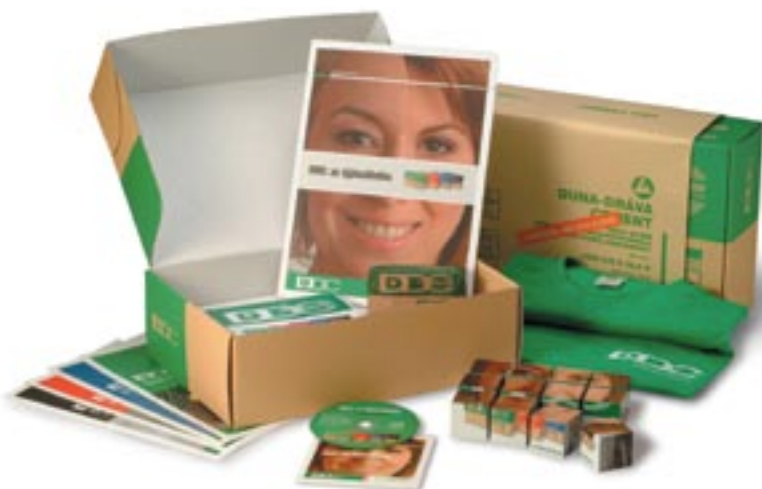
Összeállítás a „DDC: az újjászületés” kampány promóciós eszközeiből

A HeidelbergCement Group célkitűzése az, hogy a leányvállalatok világszerte azonos szervereken és egységes arculattal legyenek elérhetőek. A honlapon megtalálható a Társaság termékeinek és a Duna-Dráva Cégcsoport tagjainak bemutatása, valamint elolvashatóak a vállalat hírei. ■