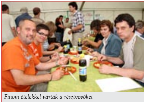
Finom ételekkel várták a résztvevőket

A magyar műszaki társadalom jeles eseménye alkalmából általában elismeréseket vehetnek át azok, akik egész évben végzett