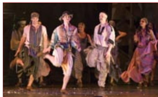
További információ: www.holcimotthon.hu .

A május utolsó napján megtartott rendezvényen nem csak az alapítványi nyertesek, de a Holcim Hungária Zrt. legfontosabb üzleti partnerei és kollégái is részt vettek. A vendégek egy igazi kulturális ínycsiklogással gazdagodhattak a méltán híres Experidance tánc csoport „A nagyidai cigányok” című előadásán.