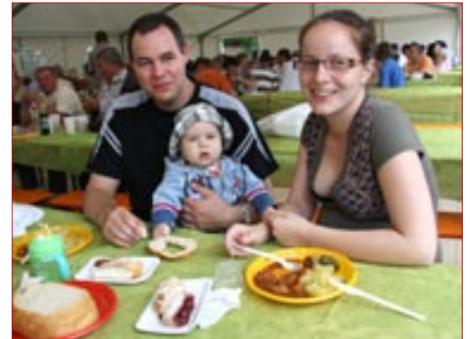
Egészen picik is eljöttek az Építők Napjára

A rendezvény programját motoros rendőrök, tűzoltók színesítették, késő délután pedig a Defekt Duó zenés-humoros előadását formációs táncbemutató és a Fantasy Band műsora követte.