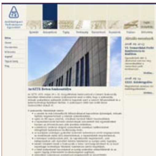
A honlap megújulásával együtt új e-mail címe is van az Egyesületnek, ahová megtisztelő észrevételeiket szívesen várjuk: info@szte.org.hu címen.

A honlap egyes részei még szerkesztés alatt állnak, de igyekszünk ezeket az információkat is mielőbb közzétenni. Így például hamarosan az egész honlap olvasható lesz angol nyelven is.