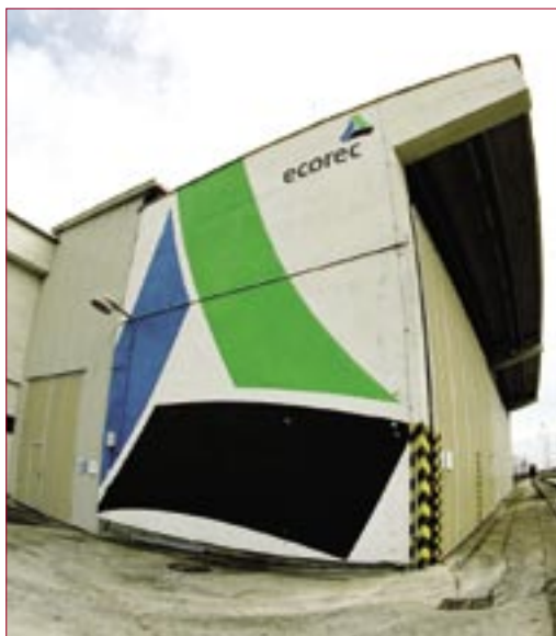
A cég logója várhatóan a jövőben számos épületen megjelenik

Az ecorec nemzetközi cégcsoport tagjaként tevékenykedik Magyarországon az ecorec Hungária Kft., melynek távlati célja tiszta és egészséges környezet biztosítása a jövő nemzedékei számára.