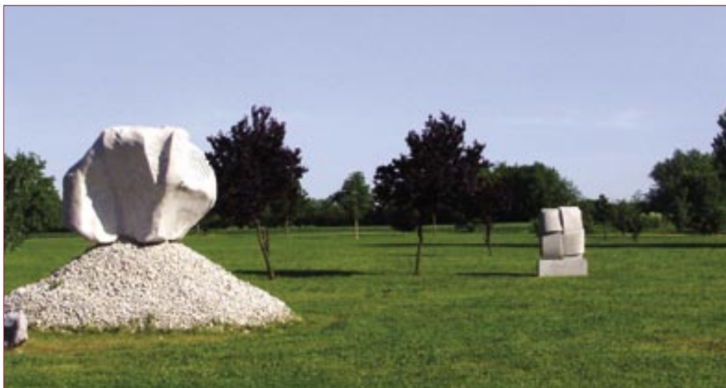
Az első Magyar Környezetkímélő Betonszobrászati Szabadtéri Szoborpark Beremenden

1964-ben Rétfalvi Sándor fiatal pécsi szobrászművész meghívást kapott a Bécsben megrendezett Első Európai Szobrász Szimpozionra. 1967-ben fiatal képző- és iparművészekből, a pécsi Művészeti Szakközépiskola fiatal művésztanáraiból közösséget teremtett, aminek eredményeként Villányban a Gyimóthy villában létrehozták az első Magyar Képzőművészeti Szimpoziont. Ekkor rakták le az immár európai hírű Nagyharsányi Szabadtéri Szoborpark alapjait.