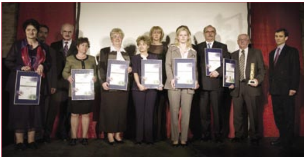
Holcim Díjazottak 2006

Immár hagyomány, hogy minden évben a Holcim Hungária pályázatot ír ki gyárai környezetének fejlesztéséért, és a közösségek életének fellendítéséért.