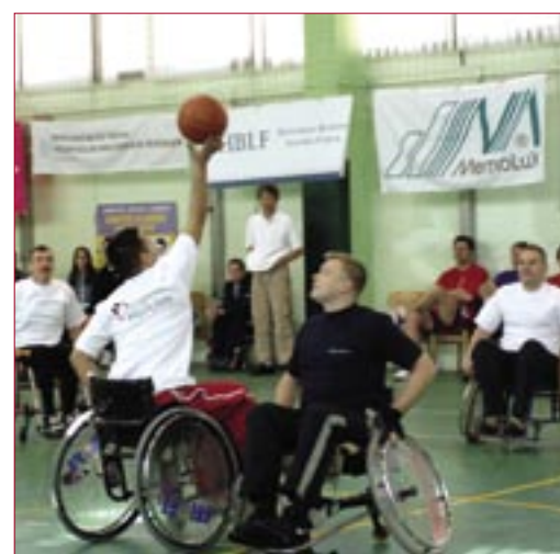
A Holcim csapata a 2. helyet szerezte meg

A csapatok díjait, melyek összértéke – a Shell Hungary Rt., a Magyar Telekom Nyrt. T-Mobile üzletága, a TESCO Global Áruházak Rt. és a Provident Pénzügyi Rt. támogatásának köszönhetően – meghaladta a 250.000 Ft-ot, felajánlották a mozgássérült sportolók számára. Köszönet illeti a Coca-Cola Beverages Magyarország Kft-t is a támogatásukért. ■