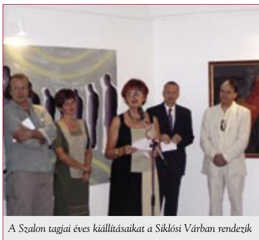
A Szalon tagjai éves kiállításukat a Siklói Várban rendezik

1964-ben Rétfalvi Sándor fiatal pécsi szobrászművész meghívást kapott a Bécsben megrendezett Első Európai Szobrász Szimpozionra. 1967-ben fiatal képző- és iparművészekből, a pécsi Művészeti Szakközépiskola fiatal művésztanáraiból közösséget teremtett, aminek eredményeként Villányban a Gyimóthy villában létrehozták az első Magyar Képzőművészeti Szimpoziont. Ekkor rakták le az immár európai hírű Nagyharsányi Szabadtéri Szoborpark alapjait.