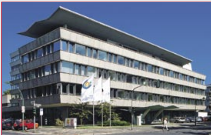
Az Európai Cement Kutatási Akadémia székhelye

A programokon, ill. rendezvényeken az ECRA tagjai vehetnek részt. 2006. elején az ECRA 38 tagot számlált, melyhez ez évtől a budapesti székhelyű CEMKUT Cementipari Kutató-fejlesztő Kft. is csatlakozott, mint teljes jogú tag. A cementipari társaságok akkor kérhetik felvételüket a tagok közé, ha saját nemzeti cementipari szövetségüknek is tagjai. A nemzeti cementipari szövetségek szintén lehetnek ECRA tagok. Az Európában működő cementipari társaságok és az európai országok cementipari szövetségei számára az ECRA tagság teljes jogú tagságot jelent. Az Európán kívüli cementgyártók és cementipari szövetségek ún. „társtagság”-ért folyamodhatnak. A cementipari társaságok eldönthetik, hogy az ECRA tagságot társasági, gazdasági egység vagy gyári szinten kérik.