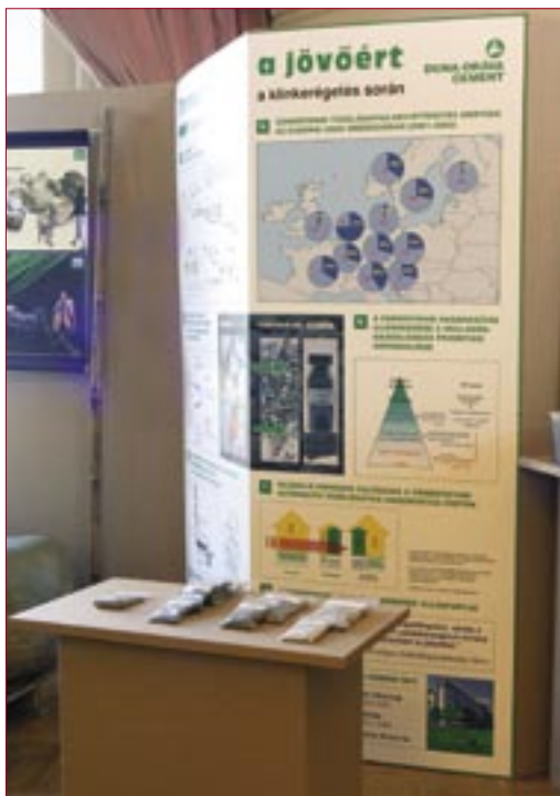
Duna-Dráva Cement Kft. a Hulladékból termék, 2006 kiállításon

Posztmodern korunk egyik bűvszava az újrafelhasználás. A hulladék iránti megnövekedett érdeklődést jórészt a kényszerűség indokolja, hiszen az emberiség minden korábbit meghaladó mértékben árasztja el szeméttel a környezetét. Egyre többen ismerik fel a hulladékban rejlő lehetőségeket is: az emberi fantázia, találékonyság és kreativitás a legváltozatosabb módokat fedez fel a hulladékok „újraalkotásának”.