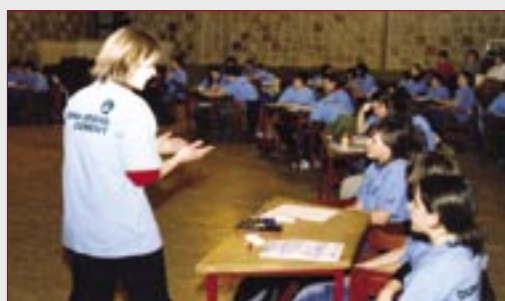
Magas színvonalú versengés folyt, komoly kérdésekkel és kitűnő válaszokkal

A rendezvény gondolata a pécsi Szivárvány Gyermekházban meghonosított testvérvárosi vetélkedőkből született meg. A Duna-Dráva Nemzeti Park Igazgatósággal, és a cementipari társasággal 2005-ben alakult hármassá az együttműködés. Akkor a Duna-Dráva Nemzeti Park természeti értékeihez, a Kopácsi rét élővilágához kötődő feladatokat oldottak meg a jelentkezők. Az idei évben kapcsolódott be a Duna-Ipoly Nemzeti Park, és így jelentősen megnövekedett az érintett iskolák száma is.