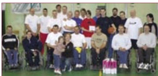
Az Ernst & Young Kft. csapata a harmadik helyen végzett

Idén kilenc csapat vett részt a versenyen a következő cégek képviseletében: ATEL Csepeli Áramtermelő Kft., Ernst & Young Kft., Holcim Hungária Zrt., ICI Hungária Kft., a Magyar Telekom Nyrt. T-com és a T-Mobile üzletága, Memolux Kft., Oppenheim és Társai