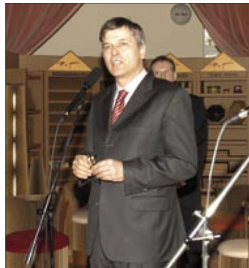
A kiállítást Demszky Gábor, Budapest főpolgármestere nyitotta meg

A kiállítás berendezése, a falak, az asztalok, a székek – teljes összhangban a rendezvény