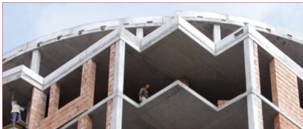
Építmények minősége = kiváló építési termék és szakszerű beépítés