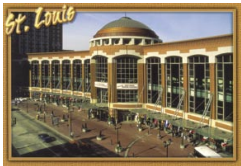
A konferencia helyszíne (America's Center)

Az előadás a CEMKUT Kft.-ben évek óta a szemcseméret-eloszlás szerepe a kompozitcementek minőségének alakulásában című témakörben végzett – tudományosan is megalapozott – cementipari kutatások eredményeire épül. Az előadásban a szerzők ismertették az általuk kifejlesztett – a pernyének, ill. pernyetartalmú cementeknek – a szemcseméret-eloszlás mért adataiból függvényközelítéssel történő fajlagos felület számítási módszert.