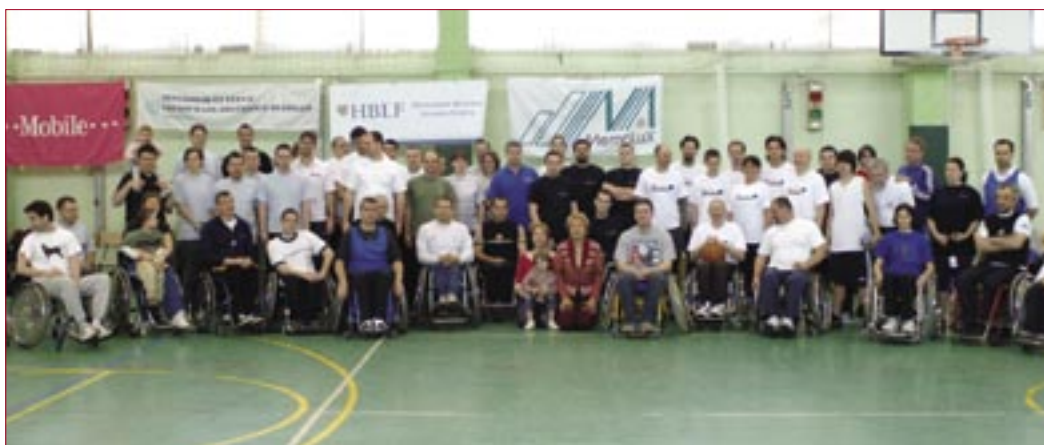
A verseny győztese ICI Hungária Kft. csapata lett

A Hungarian Business Leaders Forum (HBLF) negyedik alkalommal rendezte meg kerekesszékes kosárlabdaversenyét, melynek a Törekvés SE sportcsarnoka adott otthont 2006. április 8-án. A mozgáskorlátozottak által üzött sportágak közül a kerekesszékes kosárlabda nemzetközileg ugyan nagy hagyományokkal