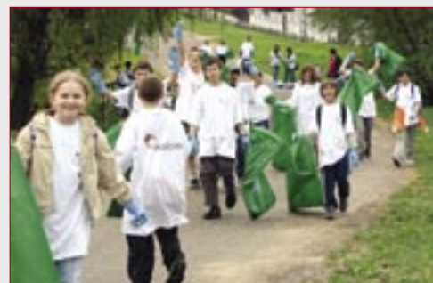
Közös összefogással tisztábbá lehet tenni környezetünket